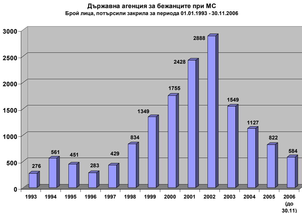
Фиг.7 Търсеци убежище за периода 01/01/1993 – 30/11/2006 г.

Освен това, от 1993 до септември 2001 г., имаше само няколко непълнолетни без придружители, докато през първото тримесечие на 2002 г. бяха регистрирани 21 непълнолетни без придружители.